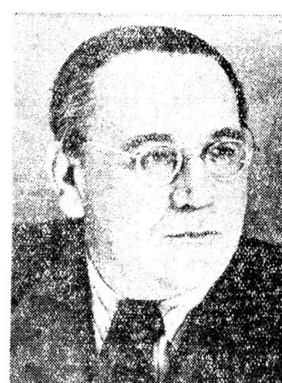
С. Я. МАРШАК