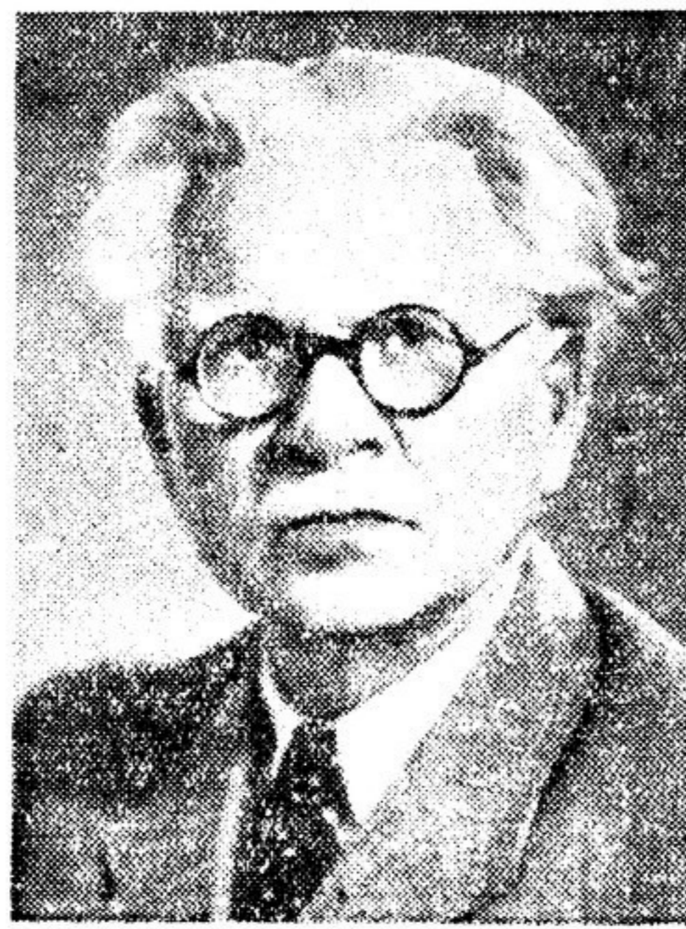
Ф. В. ГЛАДКОВ